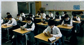
▲ 熱心に読書に励む生徒たち

今年で20年目となる「全校一斉朝の読書」が4月19日(金)~27日(土)に実施された。高校は年2回実施し、中学校は通年で取り組み始めて6年目となる。年々落ち着きを感じられ、集中して取り組んでいる生徒が多く見られるようになった。また、図書委員の呼びかけもあり、本を準備する様子からも「朝の読書」が定着しているように思う。