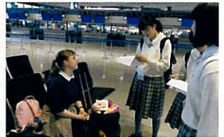
▲ 成田空港でインタビュー

一日の終わりには英語で日記を書き、ネイティブの先生方に添削していただきました。キャンプの集大成である英語劇では、伝統的な昔話に現代風のアレンジを加え創造的な物語を作成しました。どのグループも一生懸命練習し、全身で英語による物語の世界を表現しました。またエンディングセレモニーではネイティブの先生方へお別れのメッセージを送り、中には感極まって号泣する生徒もいました。3日間の短いキャンプでした