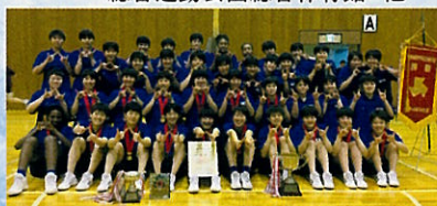
▲ 表彰式後の集合写真

本年度になり、昨年度まで2枠あった出場枠が1枠となり、緊張感のある県予選会であった。全国大会本戦に向け、個人のレベルアップとチームとしてのスキルアップをして大会に臨みたい。目標は「目の前の勝負に勝つ」こと。