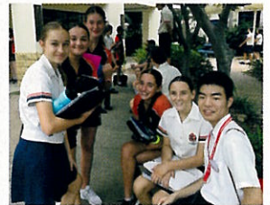
▲ 現地の学生と交流

3月22日~29日、中学校3年生11名によるオーストラリア語学研修が行われた。現地受け入れ校は、ブリスベン州クメラにある私立の幼小中高一貫校「St. Stephen's College」で、ガイダンスを含めた3日間を過ごした。学校では、現地の中学生のバディと2人1組で行動し、バディが受講している授業と一緒に参加し、現地の授業を体験した。最初は授業の内容を理解することももちろん、バディとのやり取りもぎこちなかった。しかし、一緒に授業を受けたり、おやつタイムを過ごしていく中で、バディと仲良く会話を楽しんだり、授業の内容を教え合う姿も見られるようになった。最後の修了証授与の際には、バディと楽しくピザを食べている姿が印象的だった。