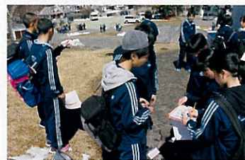
▲ グループでの野外活動

二日目は、野外活動が中心となった。謎解きBBQ・白樺GOといったプログラムが実施され、生徒たちは各グループで協働性・判断力などを駆使して競い合った。ホテルでのHR活動