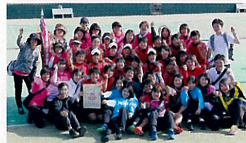
▲ 大会後の集合写真

今年度は個人戦5ペアと団体戦での出場となります。チーム力も個の力もまだまだ伸びしろがあるので、レベルアップして本番に挑みます。昨年の悔しさを糧に「己と闘う」をテーマに優勝を狙います。応援よろしくお願いします。