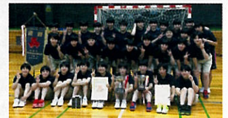
▲ 決勝戦後の表彰式にて

昨年度のインターハイ、地元での全国選抜では接戦の末、序盤で敗れ上位進出を逃している。今年はその悔しさを胸に、接戦を勝ちきる準備をして初戦を迎えたいです。ベンチ、スタンドを含め、チーム全員で新たな昭和学院のハンドボールを最大限に披露し、優勝戦線に絡みたいと考えています。応援、宜しくお願い致します。