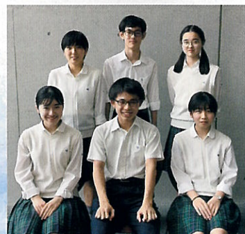
▲ 奨学会・同窓会奨学生のみなさん

また同窓会では、各部活動の大会・コンクール等への出場など、みなさんの活躍を支援しております。