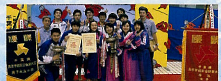
▲ 千葉県総体男女総合優勝

水泳部は7/20~22に山梨県にて行われる関東大会でインターハイ出場が決まります。千葉県総体では個人10名17種目・男女全てのリレー種目でインターハイの標準記録を突破することが出来たので、熊本へ一人でも多くの選手が行けるよう頑張ります。