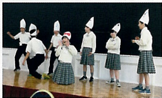
▲ 様々な英語劇に挑戦

自分の気持ちを伝えました。少人数クラスで英語によるディベートや屋外アクティビティなどを体験しました。