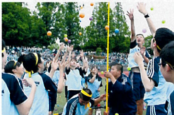
▲ ダッシュ玉入れの様子

6月3日(月)、国府台スポーツセンター競技場でスポーツ大会が開催された。前日の雨で開催が心配されたが、曇り空の中予定通り開始された。競技が進むにつれスッキリとした青空になり、赤、白、黄色に分かれ熱戦が繰り広げられた。綱引き・ダッシュ綱引き・学級対抗リレーではクラス一丸となり競い合った。また、棒引き、騎馬戦、台風の日などでは、各色が学年を超えて団結し、まとまりが見られた。昭和学院の伝統といえる応援合戦では、3年生を中心に各色の応援団が工夫を凝らした発表をみせ、白熱したものとなり、会場からは惜しみない拍手が送られた。最後の色別対抗リレーでは選手・観客の熱意が最高潮となり、会場全体が一つになった瞬間であった。6学年揃って参加する今年度初の学校行事となるスポーツ大会は、テーマ通りまさに「一体」となり、生徒の底力を実感し、熱意と感動あふれる素晴らしい一日となった。