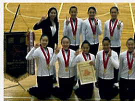
▲ インハイ予選優勝

昨年度は平成最後の覇者となった。今年は令和初の全国制覇を目指し連覇を成し遂げたい。伝説のパレエダンサーであるニジンスキーを想い作成された「ニジンスキーに捧ぐ」の音楽にのせ、昭和学院でなければ演じられない世界観を表現したい。