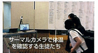
サーマルカメラで体温を確認する生徒たち

意を払いながらの学校再開となりました。普段とは異なる事に気を付けながらの登校や学校生活で、いつも以上に緊張している場面も見られましたが、直接顔を合わせて交流を深める中で段々と笑顔も増えていきました。今後も注意を続けていく必要はありますが、現状の中でもできる活動をどんどん推進し学校生活をより充実させられるように計画中です。