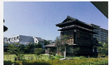
創立記念館(国の登録有形文化財)

昭和学院は、このような次の時代を担い、新しい日本の発展をリードする人材を育てるために全力を挙げて参ります。生徒さんが高い目標を持ち、その実現を目指して、集中力を以て一層の勉学に励み、部活や学校活動に取り組んで、有為な日本人に育ってくれることを期待しています。