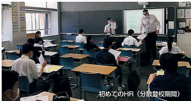
初めてのHR(分散登校期間)