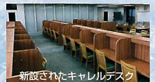
新設されたキャレルデスク

中高とも本年度1年生から新しい制服とともに新コース制がスタートしました。中学校ではインターナショナルアカデミーコース(IA)31名、アドバンスアカデミーコース(AA)60名、ジェネラルアカデミーコース(GA)119名の計200名、高校ではIA 17名、トップグレードアカデミーコース(TA)10名、AA38名、アスリートアカデミーコース(AA)20名、GA 262名の計347名を迎えました。IAのNativeによるホームルーム活動やTAの7限補習など早速各コースの特徴を生かした活動も始まっています。また、自習室にはキャレルデスクを設置し、一人ひとりが集中して学習に取り組める環境を整備し、放課後の学びをサポートしています。すでに多くの生徒が利用しており、今後人気のスポットになっていきそうです。