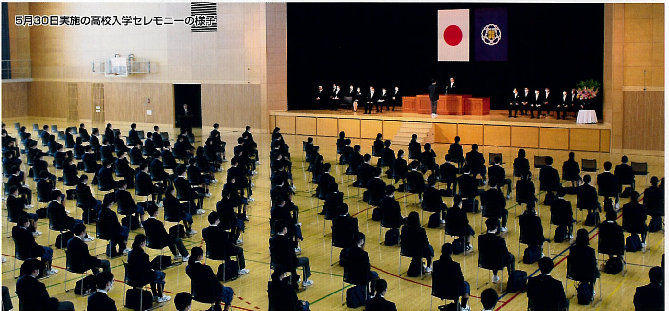
5月30日実施の高校入学セレモニーの様子

1940年に昭和女子商業学校として創立した本校は、2020年に80周年を迎えました。まずは、創立80周年おめでとうございます。