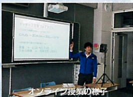
オンライン授業の様子

新型コロナウイルス感染拡大防止の観点から国の緊急事態宣言が発令される中、本校でも休校を余儀なくされ、生徒の皆さんは新年度を自宅学習でスタートすることとなりました。その間、様々な制約がある中でも、MetamojiCrassRoomでの課題配信・添削等に加えWebexでの双方向オンライン授業で、生徒と教員が互いに協力しながら学びを深めることができました。そして、5月29日の登校日、5月30日の入学式を経て6月1日からはクラスのメンバーの半分ずつが登校する分散登校が始まりました。校舎入り口にはサーマルカメラを設置し、全員マスク着用、生徒下校後は教職員が全教室のアルコール消毒を行う等、細心の注