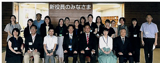
新役員のみなさま