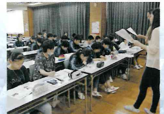
▲ 英語レッスン風景

体育館では、ネイティブの先生と様々な場面でのスキットを経験。病院・買い物・レストラン・有名人にサインをもらうなどの場面に挑戦した。別のチームは、施設の広い新緑の敷地で、ロゲーニングゲームを楽しんだ。