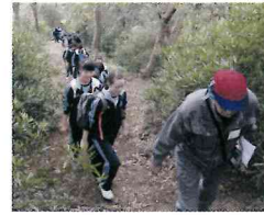
▲ ガイドウォークでの山登り

最終日は学級活動の中で、全員が将来の夢を力強く語っていた。学年集会では、前日に皆で決めた個性あふれる学級目標を各クラスの代表者が発表した。真剣に発表を聞く生徒の姿勢には、3日間での成長が感じられた。3日間の共同生活を通して、多くのことを学ぶことができた。これから高校生活を本格的にスタートする生徒たちには、学年目標である「新たな挑戦」を胸にさまざまな舞台での活躍を期待したい。