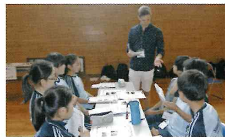
▲ 英語レッスン風景

班で協力して、隠されたヒントカードを見つけ英語でクイズに答えていくゲームは、わくわく感もあり、生徒に好評だった。午後は、各クラスで英語でのレクを楽しんだ。動き回り、思い切りジェスチャーをし、恥ずかしがらずに英語で表現する。自分の英語が伝わった時は本当に嬉しく、習った英語を使える喜びを実感した様子だった。