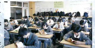
▲ 読書に集中する生徒たち

「全校一斉朝の読書」が4月20日(金)から28日(土)に実施された。中学生は通年で取り組み、高校生は年2回実施している。クラス図書委員の声かけのもと、本を準備して静かに集中して読書している様子が見られた。図書委員の感想からは、「時間が取れず、読むことが出来なかった本が読めた」「遅れて来る人もいたが、周りに気を配って着席していた」「20分の読書の時間があつという間だった」などが上げられ、有意義な一週間であったようだ。今後も読書に取り組んで欲しい。