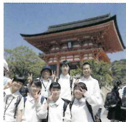
▲ シルバーガイドさんと

生徒たちは、事前学習も含めた様々な体験を通し、大きく成長したようだ。今回の経験を、これからの生活に活かして欲しい。