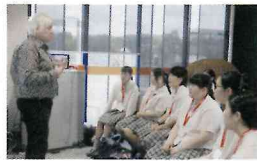
▲ 聞き取ろうとみんな真剣

3月23日～30日、本学院初となる中学3年生のオーストラリア研修が行われた。参加者は14名。研修場所はクイーンズランド州、ブリスベン。親日家も多く、気軽に日本語で声をかけられることもある都市である。