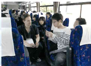
▲ 車内から英語の世界スタート