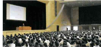
▲ 第1回SGアカデミーの様子

5月5日(水)第1回SGアカデミー：未来講座が開講された。これは在校生の「夢や理想の実現」に向けて、学習意欲の喚起や自己表現に寄与することを目的とし、2年後に迎える創立80周年を祝した記念事業の一環でもある。講師は本校教員をはじめ、社会で活躍している卒業生や専門家などで、年10回程度の実施を予定している。