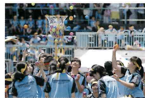
▲ 中学生による玉入れ

6月4日(月)、国府台スポーツセンター競技場でスポーツ大会が開催された。天候にも恵まれ、赤・白・黄の各色に分かれ熱戦が繰り広げられた。綱引き・ダッシュ綱引き・学級対抗リレーではクラス一丸となり競い合った。また、棒引き・騎馬戦・台風の日などでは、各色が学年を超えて団結し、楽しそうに競技に参加する様子が見られた。終盤の応援合戦は、高校3年生を中心に、それぞれ工夫を凝らした発表やエール交換などが行われた。その清々しく雄々しい姿の応援団に会場から惜しめない拍手が送られた。最後の色別対抗リレーでは生徒全員の熱気が最高潮となり、テーマであった「更なる飛躍」を達成した充実感に包まれた。6学年揃って参加する今年度初の学校行事であったスポーツ大会は、生徒の底力を実感するとともに、熱意と感動あふれる素晴らしいものとなった。今後の学校行事にもこの団結力が活かされるであろう。