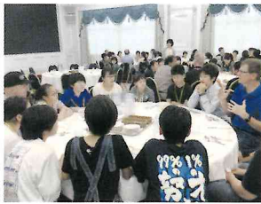
▲ クルーとの会食風景

2日目、午前のディベート本番では、相手の意見に「なるほど」と言いながらも、「しかし」と反論していく生徒が見られた。外の活動では、サッカーやキックベースなど、英語を使いながらスポーツをする姿が新鮮だった。午後は、バーでドリンクを実際に注文し、夕食にデルタ航空のクルーを英語で招待するなど、充実した時間を過ごした。特に、夕