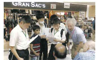
▲ 成田空港でのインタビュー

今回のEnglish Campでは、英語を話すだけでなく、英語を使って相手とつながることができた。その達成感が、今後の彼らのさらなる成長につながることだろう。