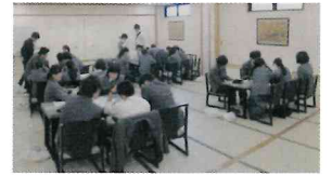
▲ 学級活動での話し合い

2日目は、内浦山県民の森にてガイドウォークを行った。普段は見過ぎてしまいがちな生き物や植物に目を向けることができた。時には険しい山道もあったが、みんなで励ましの声を掛け合いながら歩いていた