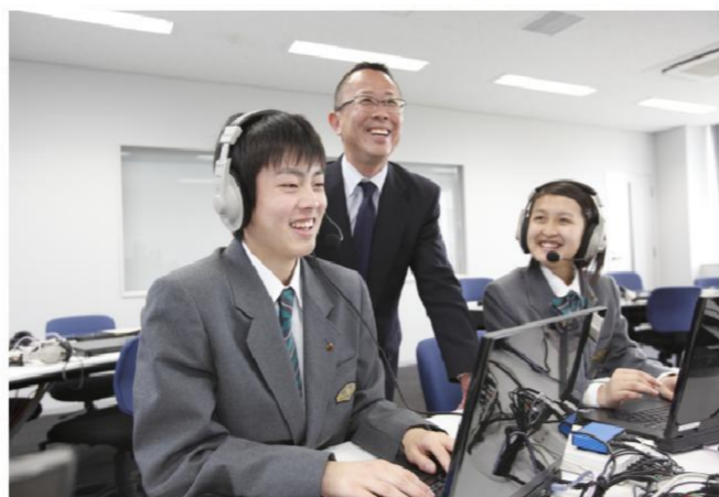
▲英検合格で得られた自信は、他の教科でも成績アップに良い影響を及ぼしています。

同校では、現役で大学に合格するために「英語力の強化」「補習の充実」「模試の有効活用」を中心に学習指導を行っています。