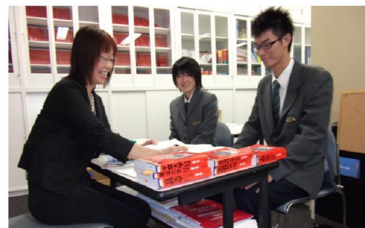
▲すべての先生が多面的な視点から生徒一人ひとりを見守り指導しています。生徒は安心感や信頼感を持ち、先生に何でも相談しています。

昭和学院高等学校では、「明・敏・謙・讓」の教育理念、明朗にして健康、自主性に富み、謙虚で個性豊かな人間の育成を基本方針に、教員と生徒の心のふれあいを大切にしている全人教育を実践しています。 また、創立70周年事業として進めてきた新キャンパスも昨年完成し、教室はもちろん、